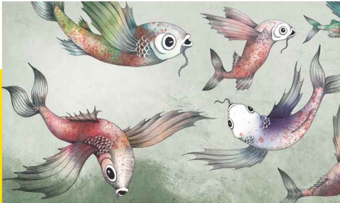
Illustration: Lea Hebsgaard Andersen