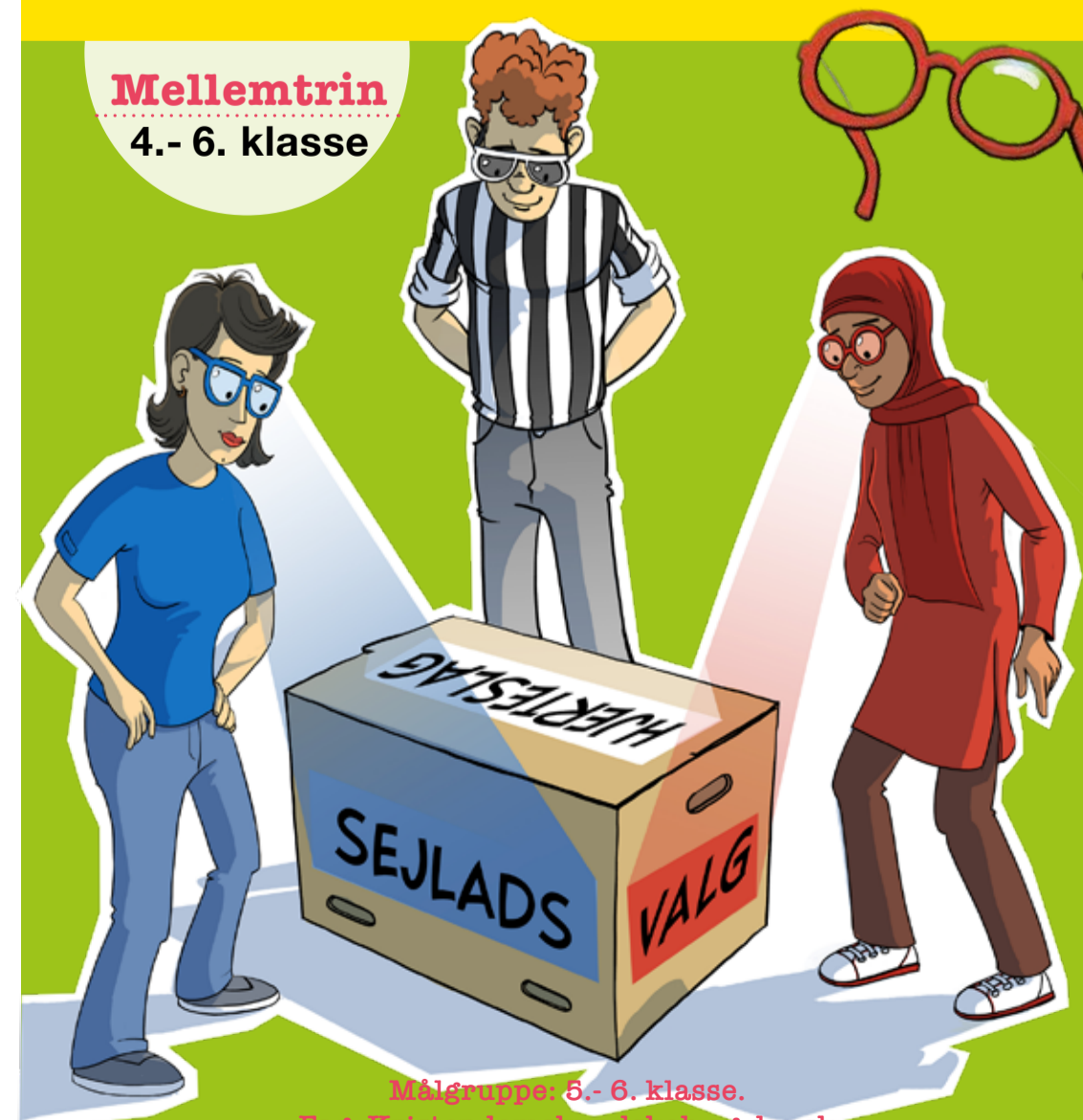
Illustration: Tryk Film

Målgruppe: 6.- 6. klasse. Fag: Kristendomskundskab og dansk Tid: September og året ud Husk kirkebesøg