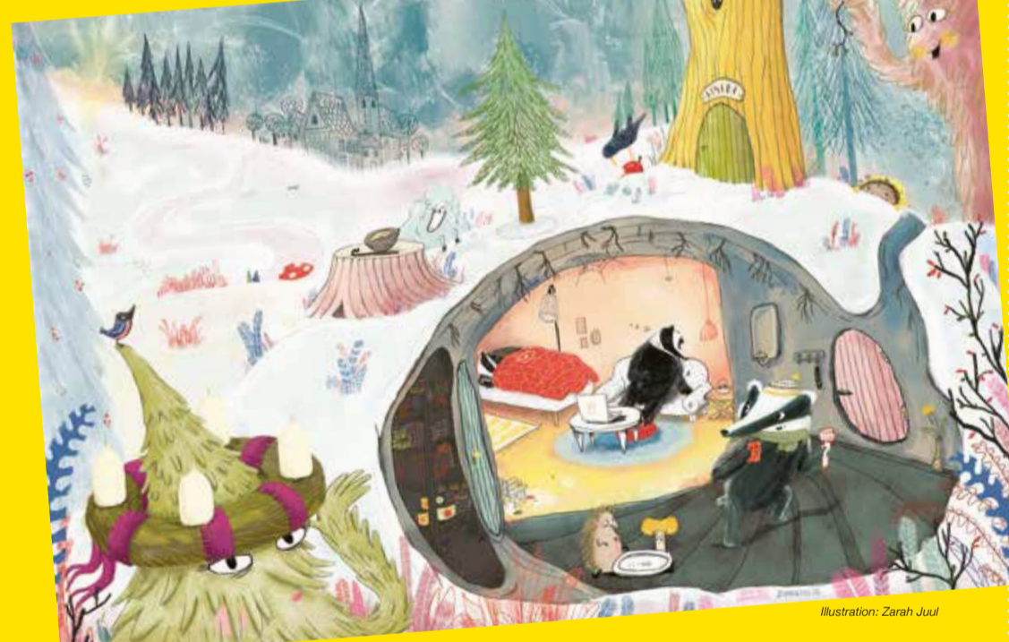
Illustration: Zarah Juul